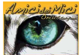
Associazione di Volontariato

Volantino con i contenuti avuti dall'Associazione La Cincia odv di Avigliana, realizzato nell'ambito del progetto, finanziato dalla Regione Piemonte - Settore benessere degli animali da compagnia nel contesto sociale, denominato: