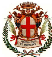
Comune di Savigliano