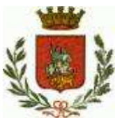
Comune di Cavallermaggiore